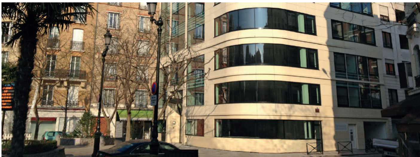
6/8, place Jean Zay - Levallois Perret (92)

Valable jusqu'à la parution du Bulletin n° 01 / 2019